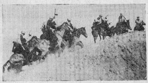
EN EL FRENTE RUSO.—Un destacamento de artillería rusa forma un bonito cuadro sobre sus corceles. Esta fotografía fué tomada en el Cáucaso, donde los rusos han avanzado considerablemente en estos últimos días y las posiciones alemanas empiezan a peligrar.