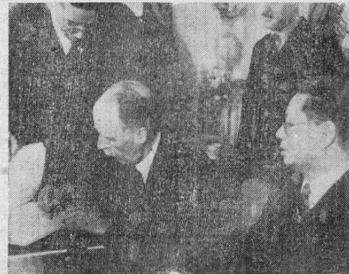
SIGN AGREEMENT BETWEEN BRITAIN AND CHINA. Chungking, China.—Relinquishing extraterritorial rights in China, British Ambassador to China, Sir Horace Seymour (seated left) signs the Sino-British Treaty at the Chinese Foreign Office in Chungking. Seated at right is, Dr. T. V. Soong, Chinese Foreign Minister, who signed for China, and standing (right), is Sir Hugh Richardson, acting Agent General of the Government of India.

odist Circuit. To his widow and other relatives we extend our profound condolence. May his soul find Peace Eternal.