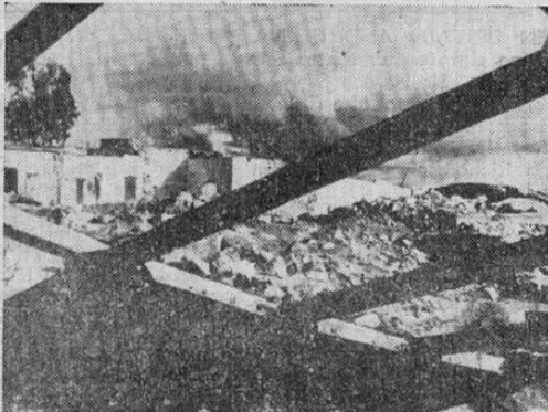
AS THE 8TH ARMY SWEEP WESTWARD, Jedabia.—Wrecked hangars and administrative buildings on the edge of the airfield at Jedabia, after the British 8th Army had driven Marshal Rommel's forces from the city near the borders of Tripolitania.

EL AVANCE EN EL DESIERTO AFRICANO.—Hangares destruidos y edificios ardiendo. Este fué el resultado de los bombardeos de la RAF, que obligaron al enemigo a retirarse a Jedabia, cerca de la línea fronteriza de Tripolitania. Jedabia está ahora en poder de las fuerzas del Octavo Ejército.